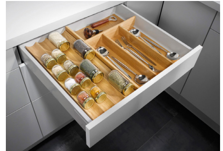
Ladenausstattung in Eiche